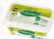
Tuk pro teplou i studenou kuchyni bio, PROVAMEL, 250 g