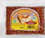
Tempeh uzený bio, SUNFOOD, 190 g