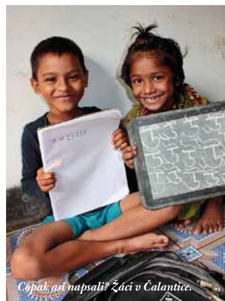
Čopak asi napsali? Žáci v Čalantice.

čům a opatrovníkům dětí, zlepšuje jejich životní i pracovní podmínky a je oporou celé místní komunity.