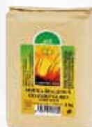
Pšeničná hladká mouka bio, COUNTRY LIFE, 1 kg